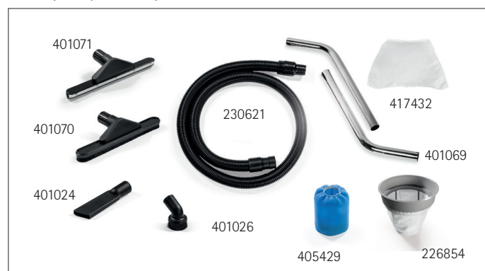
KIT D'ACCESSOIRES Ø40 (EN SÉRIE)