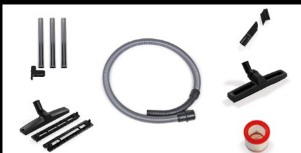
KIT D'ACCESSOIRES Ø32